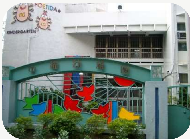
幼兒園 材料工程師徵才