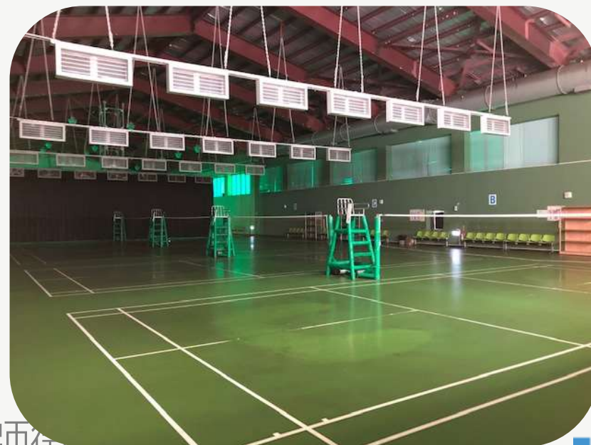
羽球場 排球場 籃球場