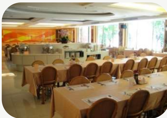
餐廳 材料工程師徵才